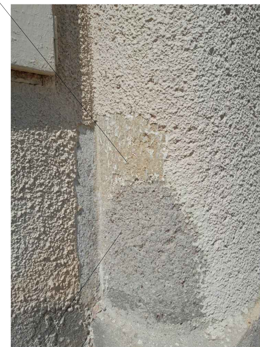
SONDA PROVEDENÁ TRYSKÁNÍM tryskání nelze použít, původní kolorovaný povrch se poškodí