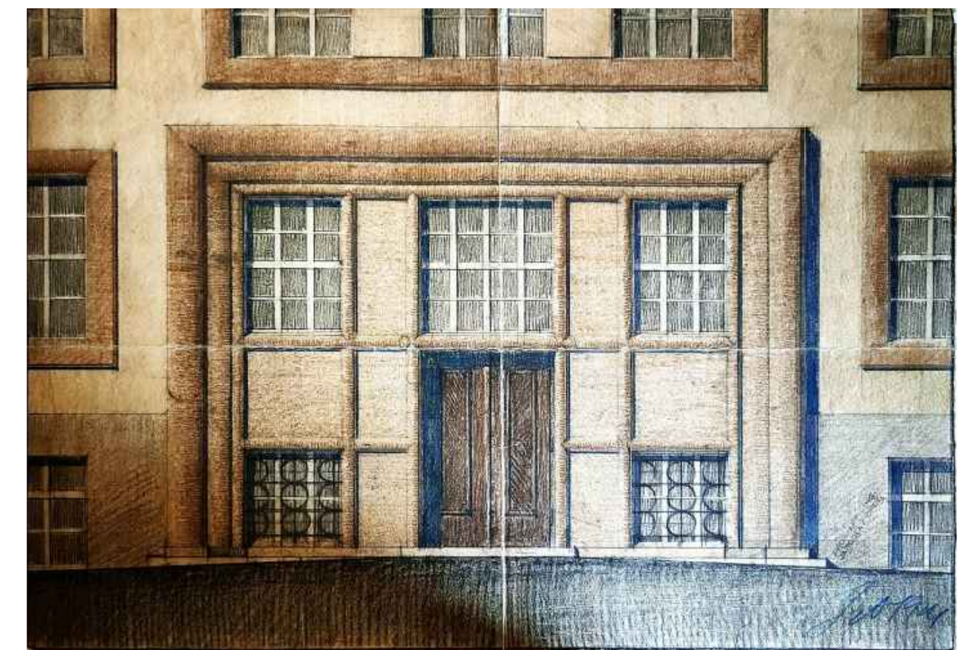
NÁVRH ING.ARCH. JAROSLAVA OPLTA Z R. 1924